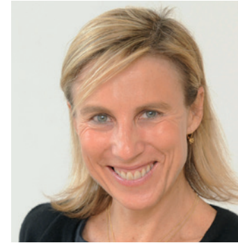
LUCIA RECALDE Creative Europe MEDIA European Commission