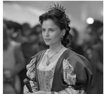
Elena Anaya a "Alatriste"

Més informació sobre la programació a: www.picture-europe.eu/en/