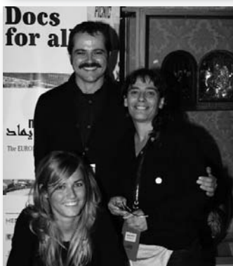
L'organització del MEDIMED