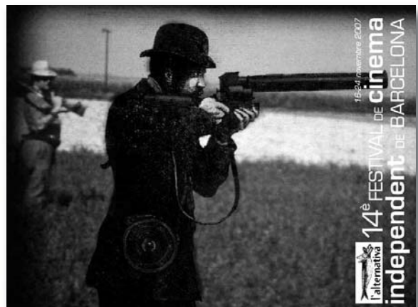
Imatge de l'Alternativa 2007

Ja és obert el termini de presentació d'obres al Festival de Cinema Independent de Barcelona, L'Alternativa 2008, que tindrà lloc del 14 al 22 de novembre a diversos espais de la ciutat. El termini es tancarà el 15 de juliol . L'Alternativa té quatre seccions competitives en les categories de llargmetratge, curts, documentals i obres d'animació. Els films presentats hauran d'haver estat produïts amb posterioritat a l'1 de gener de 2007 i rodats en 35mm, 16 mm, Betacam SP Pal, DVcam Pal o MiniDV Pal. Premis en metàl·lic per a les seccions oficials (Millor Llargmetratge, 6.000€; Documental, 4.000€; Curtmetratge, 2.000€; i Animació, 2.000€). ■