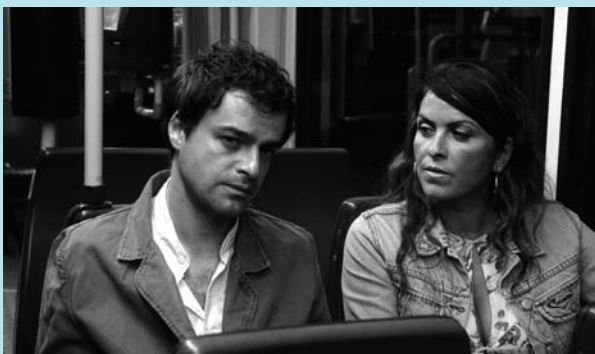
Al otro lado, de Fatih Akin (Alemanya, Turquia, 2007) Drama

La darrera producció del realitzador Fatih Akin, Al otro lado , va ser la guanyadora de la primera edició del Premi LUX de cinema del Parlament Europeu, creat l'any passat amb l'objectiu de reconèixer el paper del cinema en el procés de construcció d'Europa.