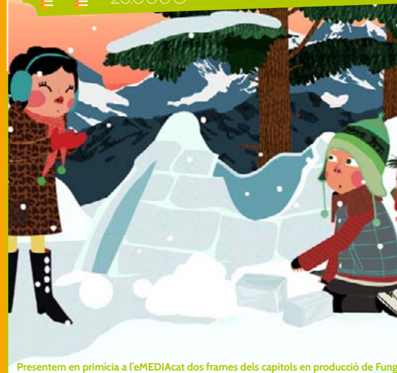
Presentem en primícia a l'eMEDIACat dos frames dels capítols en producció de Fungi

Podeu trobar més informació sobre aquestes pel·lícules i el suport MEDIA rebut a la MEDIA Films DataBase