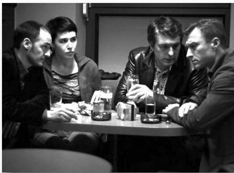
Le silence de Lorna, dels germans Dardenne