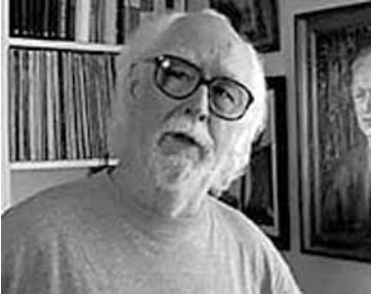
Henning Carlsen a "Cineastes en acció"