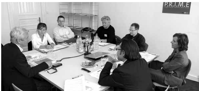
Sessió de P.R.I.M.E.

Donat la importància que té el guió i la fase prèvia al rodatge d'un projecte, la iniciativa de formació transFOCAL va posar en marxa l'any passat el curs P.R.I.M.E., que respon a les sigles: Packaging, Rewriting International Marketing Exchange. P.R.I.M.E. facilita i proporciona les eines per destriar quins pro-