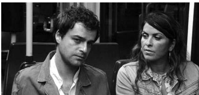
The edge of heaven