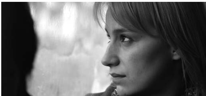
4 meses, 3 semanas y dos días

D'altra banda, la pel·lícula finesa A Man's Job , va rebre ajut al desenvolupament de projectes, en el marc de la convocatòria 86/2003, per un import de 50.000 euros. ■