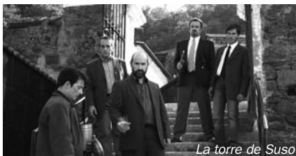
La torre de Suso