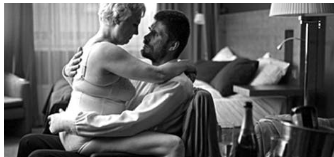
A man's job