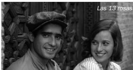
Las 13 rosas