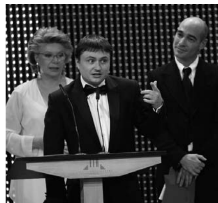
Cristian Mungiu, Premi al Millor director