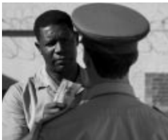
Goodbye Bafana, de Bille August

Mallorca, del 24 al 28 d'octubre de 2007