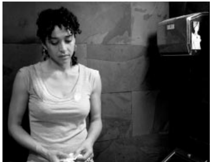
Lo bueno de llorar , de Matías Bize