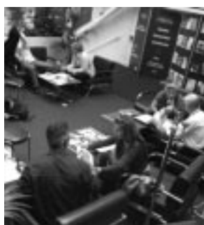
Estand de The Marketplace

L'empresa holandesa Marketplace ha rebut, un any més, la confiança del Programa MEDIA per organitzar l'Estand MEDIA Ombrel·la en els propers MIPCOM i MIPCOM Junior, que tindran lloc a Cannes el mes d'octubre; del 8 al 12 el Mercat obert a tots els gèneres, i dos dies abans, el 6 i 7, el MIPCOM Junior, especialitzat en audiències infantils i juvenils. L'Estand, de 68 metres quadrats, té cabuda per a 200 productors independents