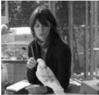
La educación de las hadas, de José Luis Cuerda

El Fons Eurimages donarà suport a la coproducció de dotze llargmetratges europeus, segons es va acordar en la darrera trobada del Consell Gestor del Fons, celebrada de l'1 al 3 de juliol a Estrasburg. L'import total dels ajuts és de 4.380.000 euros. Una coproducció espanyola amb França i Mèxic està entre les pel·lícules escollides. El llarg documental La vida loca made in USA , de Christian Poveda, coproduït per la productora francesa La Femme Endormie; l'espanyola Aquelarre