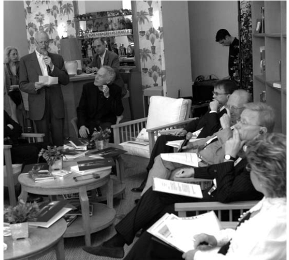
Debat sobre la Carta Europea del Cinema On-line

L'objectiu de la Carta Europea del Cinema On-line és fomentar el desenvolupament i l'acceptació del cinema en línia a Europa, contribuint a l'augment de la circulació de les pel·lícules europees. La Carta repassa quatre aspectes fonamentals de caràcter urgent per assolir aquests objectius: una oferta àmplia de pel·lícules atractives on-line, uns serveis on-line de fàcil accés per als consumidors, una protecció adequada dels drets d'autor i una col·laboració estreta en la lluita contra la pirateria. ■