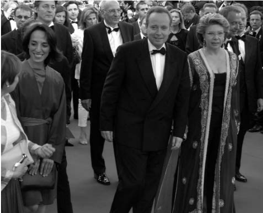
Viviane Reding i els Ministres de Cultura Europeus

El passat 23 de maig es va celebrar el Dia d'Europa, dins els actes del Festival Internacional de Cinema de Cannes. Viviane Reding, membre de la Comissió Europea responsable de la Societat de la Informació i Mitjans, es va reunir amb Gilles Jacob, President del Festival, i els Ministres europeus de Cultura presents a Cannes. Les conclusions a les quals van arribar en aquesta trobada s'han recollit en la Declaració de Cannes 2006.