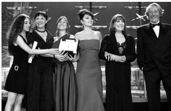
Les actrius de Volver premi a la millor interpretació femenina

D'altra banda, Pedro Almodovar va guanyar el premi al millor guió, per Volver , i la Palma a la millor interpretació femenina va recaure en l'equip d'actrius, amb Carmen Maura i Penélope