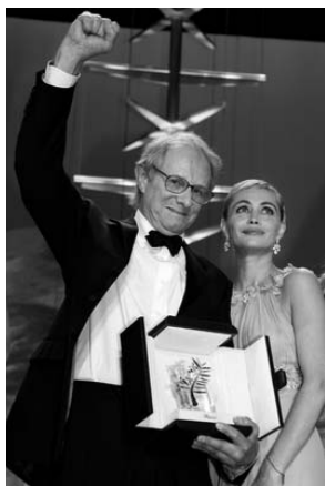
Ken Loach recollint la Palma d'Or

Tres pel·lícules amb ajut del Programa MEDIA van ser guardonades en la passada edició del Festival de Cannes. El llargmetratge The Wind that shakes the Barley , de Ken Loach, es va endur el guardó a la millor pel·lícula, en la 59ena edició del Festival de Cinema de Cannes. L'últim film de Loach va rebre ajut del Programa MEDIA al desenvolupament de projectes, a la distribució automàtica i i2i Audiovisual, per un valor total de 313.141 euros.