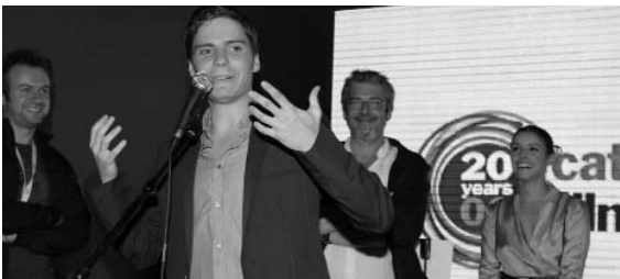
Daniel Brühl, protagonista de "Salvador" amb Tristan Ulloa, Manel Hueriga i Ingrid Rubio

Finalment, l'èxit d'aquesta trobada va culminar amb una de les millors puntuacions sobre l'organització i contingut d'actes relacionats amb el Festival de Cannes, atorgada per la revista Hollywood Reporter .