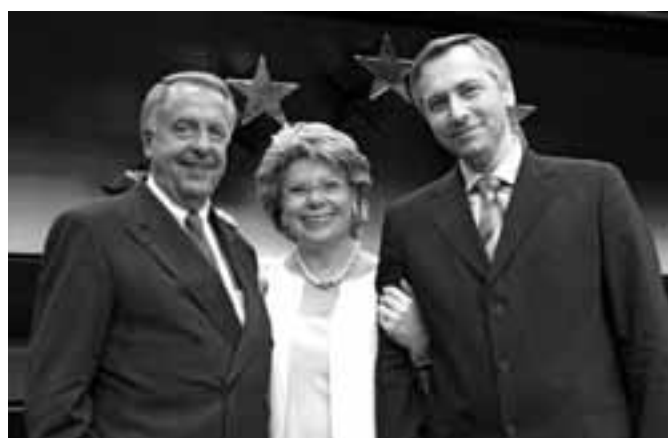
Viviane Reding amb Bernd Neumann, Ministre d'Estat per la Cultura i els Mitjans, i Ján Figel, Comissari responsable d'Educació, Formació, Cultura i Joventut

El compromís dels Ministres de la UE amb el sector audiovisual va quedar confirmat amb l'adopció de la directiva relativa als serveis de mitjans audiovisuals sense fronteres. Aquesta directiva modernitzarà les normes aplicables als serveis de mitjans audiovisuals, tradicionals i emergents, i proporcionarà