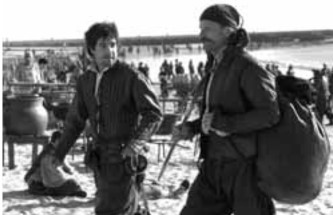
Alatriste , d'Agustin Díaz Yanes