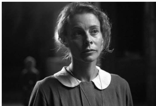
El orfanato , de J.A. Bayona

Les pel·lícules europees han patit un increment molt lleuger de la seva quota de pantalla, de només dues dècimes respecte l'any 2006, situant-se en un 28,8%. Les produccions franceses segueixen essent les que més contribueixen a augmentar aquesta quota, amb un total del 8,5% de les entrades venudes el 2007. Malauradament, en el cas de les produccions espanyoles, només van ser vistes per un 1,2% del total dels espectadors de la UE l'any 2007. Tot i així, El Orfanato , de J.A. Bayona, està entre les cinc pel·lícules més vistes, amb 4,27 milions d'espectadors. ■