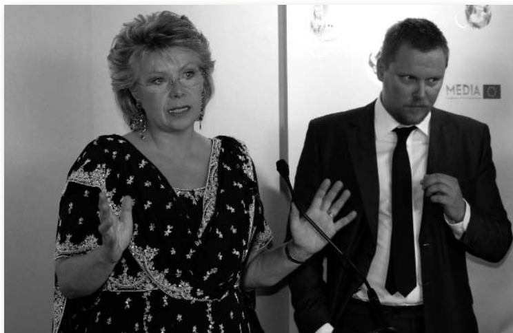
EUROPEAN COMMUNITY, 2008 | CANNES, FRANCE