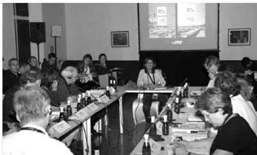
Pitching al Medimed 2007

Segons els resultats oficials del segon termini de la convocatòria MEDIA d'ajut a la promoció i mercats, EACEA 14/2007, el Mercat del Documental Euro-Mediterrani, MEDIMED, rebrà un cop més suport de MEDIA, per un total de 80.000 euros. Així mateix, el Mercadoc 2008 de Màlaga, també dedicat al sector documental, rebrà 40.000 euros; i a la Sales Office del Festival de Cinema de San Sebastián li seran atorgats 30.000 euros. En total, 28 iniciatives de promoció europees han estat seleccionades en aquest termini, entre les que també es troben els European Film Awards, el Sunny Side of the Doc, o la propera edició del Cartoon Forum a Ludwigsburg. ■