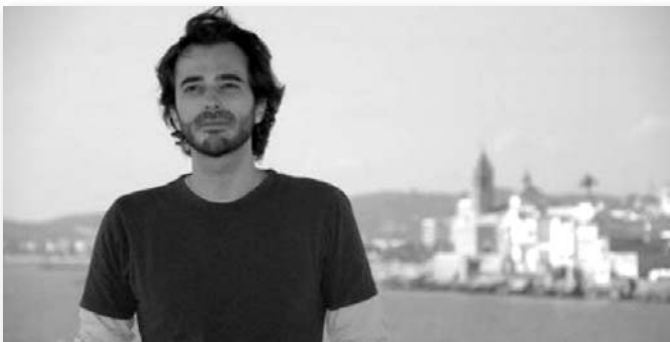
El rey de la montaña , de Gonzalo López Gallego

Més informació: http://www.coe.int/T/DG4/eurimages/