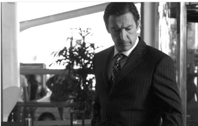
Hotel Tivoli , d'Antón Reixa

A la Setmana de la Crítica també hi participaran els films Eurimages Snow , d'Aïda Begic, i Grown Ups (Les grandes personnes) , d'Anna Novion. ■