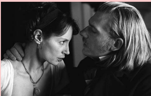
La duquesa de Langeais, de Jacques Rivette (França, Itàlia, 2007) Drama

Tant La duquesa de Langeais , com el darrer film de Chabrol, Una chica partida en dos , giren entorn el món de la seducció i l'enamorament entre homes i dones, però des de punts de vista i èpoques diferents. La isla de las almas perdidas , la pel·lícula danesa infantil més cara de la història, ens trasllada fins a un món fantàstic, on cal creure en fenòmens que la raó posaria en dubte.