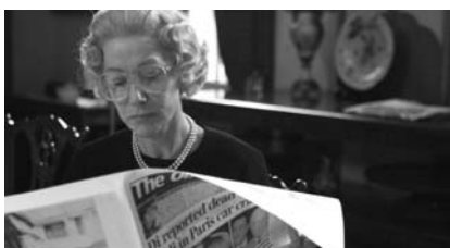
Helen Mirren a "The Queen"

El llargmetratge alemany La vida de los otros , de Florian Henckel Von Donnersmarck, ha guanyat l'Oscar a la millor pel·lícula de parla no anglesa, en la darrera edició dels premis de l'Acadèmia de Hollywood, celebrats a Los Angeles el passat 25 de Febrer. La vida de los otros va rebre 0.5 milions d'euros del Programa MEDIA, per a la seva distribució cinematogràfica i en DVD fora d'Alemanya. En paraules de la Comissària Europea de la Societat de la Informació i Mitjans, Viviane Reding, "un cop més, un Oscar enalteix els colors del Cinema Europeu". Reding ha destacat també que el