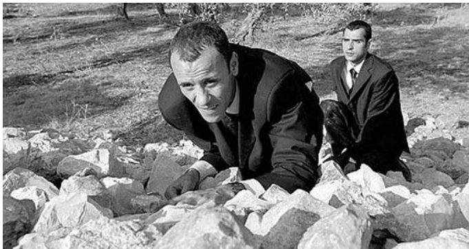
"Paradise Now", de Hany Abu-Assad

Cannes (França), del 14 al 16 de maig de 2007