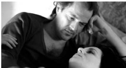
"La vida de los otros"