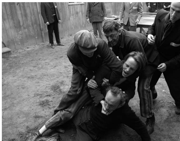
The Counterfeiters, d'Stefan Ruzowitzky