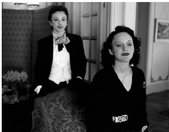
La vie en rose, d'Olivier Dahan

El reconeixement a la cinematografia europea no acaba aquí. Javier Bardem va recollir el guardó al Millor Actor de Repartiment, per la seva interpretació d'un assassí en sèrie a la pel·lícula dels germans Coen, No Country for Old Men ; els britànics Daniel Day-Lewis i Tilda Swinton, es van endur l'Oscar al Millor Actor i a la Millor Actriu de Repartiment, respectivament; el guardó a la Millor Cançó Original, va ser per a Falling Slowly , tema principal de la pel·lícula irlandesa Once ; l'Oscar al Millor Curtmetratge de ficció, per al film francès Le Mozart des Pickpockets o el premi al Millor Curtmetratge d'Animació que es va atorgar a la coproducció entre el Regne Unit i Polònia, Peter & the Wolf . ■