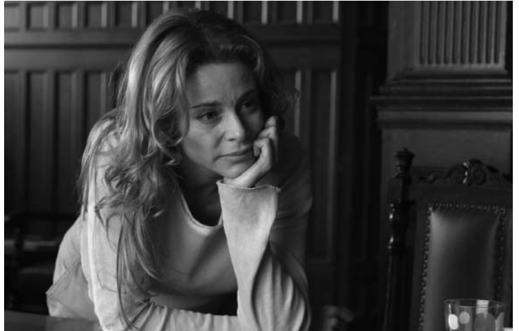
El orfanato , de J. A. Bayona

L'any 2007 el cinema català va tenir un increment d'espectadors del 15% a Catalunya, malgrat la davallada generalitzada de públic, que ha estat d'un 6% a Catalunya, un 7,7% a Espanya i un 2,2% a nivell Europeu. Dels 1.792.535 espectadors l'any 2006, es va passar a 2.072.945 espectadors l'any passat, segons dades de l'Institut Català de les Indústries Culturals. Per primera vegada, l'assistència de públic ha superat els 2 milions d'espectadors gràcies, en bona mesura, a l'èxit de taquilla de El Orfanato , de J.A. Bayona, i de REC , de Jaume Balagueró i Paco Plaza, que han suposat el 55% de la recaptació total de les produccions catalanes. Només a Catalunya, El Orfanato va tenir 760.118 espectadors, i REC , 344.616 espectadors. ■