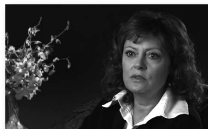
Susan Sarandon a Hollywood contra Franco

La pel·lícula documental Hollywood contra Franco , produïda per Àrea de Televisió, en associació amb TVC i la participació de TVC, TVE, l'ICAA, l'ICIC, i amb ajut MEDIA al desenvolupament, ha rebut el 2on Premi Tiempo de Historia a la 53ª Semana Internacional de Cinema de Valladolid. Hollywood contra Franco aprofundeix en l'impacte que la Guerra Civil espanyola i el franquisme van tenir en el cinema nord-americà d'aquella època, amb testimonis com els de l'actriu Susan Sarandon. ■