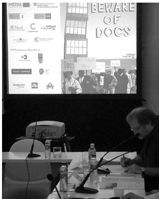
Sessió de pitching al Medimed 2008

Televisió; Rif 1921, una historia olvidada , de Maestranza Films; i Domingo a las cinco , de Bat a Bat. Mirando al cielo és un documental històric sobre els bombardejos sistemàtics que va patir Barcelona durant el març de 1938 per l'aviació italiana feixista. 300 persones van perdre-hi la vida i milers de ciutadans es van quedar sense casa. El llargmetratge documental es va presentar com a projecte en l'edició del MEDIMED 2005. La darrera edició del MEDIMED, celebrada a Sitges del 10 al 12 d'octubre, va comptar amb la participació de més de 200 professionals, entre productors, realitzadors, executius de televisió i distribuïdors internacionals, procedents d'un total de 34 països. ■