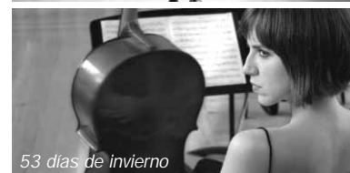
53 días de invierno