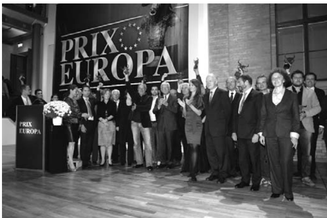
Els guardonats al Prix Europe 2007

Prix Europa és una iniciativa que des de l'any 1987 organitza el Consell d'Europa i la Fundació Cultural Europea, amb el suport que la Unió Europea concedeix a les activitats europees en el camp de la cultura. Enguany s'ha celebrat la 21 a edició, del 13 al 20 d'octubre, a Berlín. Actualment s'atorguen 13 premis, en 9 categories, per guardonar els millors programes