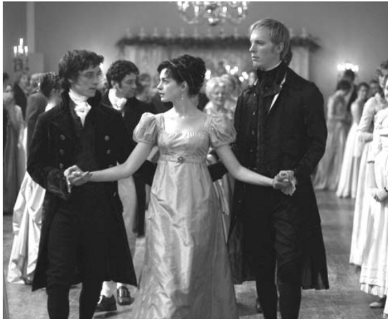
Becoming Jane , distribuïda per Notro Films

El Programa MEDIA continua posant èmfasi en donar suport a la circulació de pel·lícules europees fora del seu país de producció. En aquest sentit, 15 títols europeus es programaran, amb el suport de MEDIA, a les sales de cinema espanyoles.