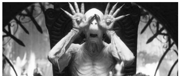
El Laberinto del Fauno