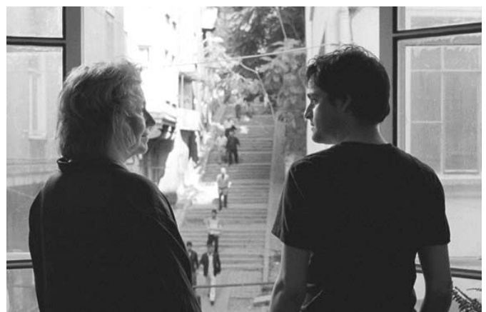
Auf der Anderen Seite , de Fatih Akin

La coproducció germano-turca, Auf der Anderen Seite , dirigida per Fatih Akin, ha estat guardonada amb el 1er Premi Lux de Cinema, atorgat pel Parlament Europeu. El premi està valorat en 90.000 euros per cobrir les despeses de subtitulat i el kinescopat de l'obra a 22 llengües de les 23 llengües oficials de la UE. Coincidint amb el 50è aniversari del Tractat de Roma, el Parlament Europeu ha creat aquest premi com a reconeixement a les pel·lícules que millor reflecteixin el debat sobre la integració d'Europa, i promoguin els valors de la UE, així com facilitar la circulació de pel·lícules europees. El jurat va estar format pels diputats del Parlament Europeu. Les altres dues pel·lícules finalistes van ser: 4 meses, 3 semanas y 2 días , de Cristian Mungiu; i Belle Toujours , de Manoel de Oliveira. ■