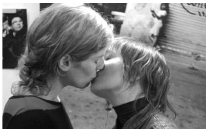
"En la ciudad", de Cesc Gay

La seu del Parlament Europeu a Brussel·les acollirà durant 10 mesos un cicle de cinema espanyol, en motiu del 20è aniversari de l'entrada de l'Estat Espanyol com a membre de