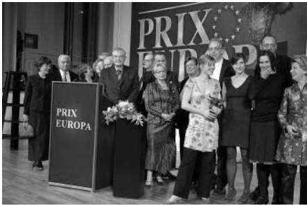
Cerimònia de lliurament dels premis

Mañana al mar ha estat guardonat amb el Prix Europa 2006 al millor documental per a televisió. El documental fa un retrat de la comunitat de banyistes, d'entre 70 i 90 anys d'edat, que cada dia de l'any, estiu i hivern, van a la platja de la Barceloneta. Mañana al mar és una coproducció hispano-alemanya, entre Televisió de Catalunya, Polar Star Films, ZDF, Arte i HFF. Prix Europa s'ator-