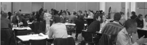
Jornada de treball al Berlinale coproduction market

La Berlinale Co-Production Market és una iniciativa adreçada a produc-