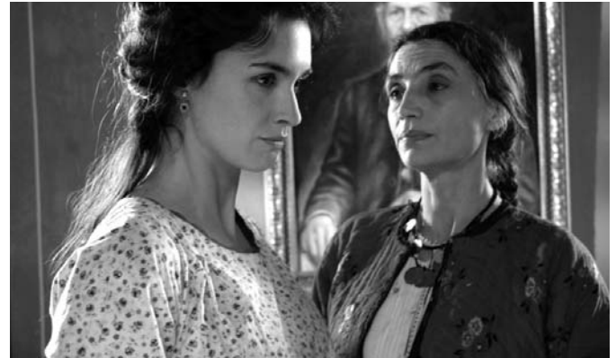
El destino de Nunik, dels germans Taviani

Com en edicions anteriors, l'EFA donarà a conèixer els nominats als European Film Awards, entre els quals hi ha tres pel·lícules de directors espanyols preseleccionades: Alatriste , d'Agustín Díaz-Yanes; Ladrones , de Jaime Marqués; i La noche de los girasoles , de Jorge Sánchez-Cabezudo. També està pre-nominada la coproducció amb participació de Castelao Productions, El perfume . La gala de lliurament de premis se celebrarà a Berlín el proper 1 de desembre. ■