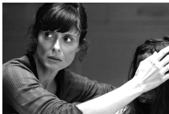
Bosque de sombras