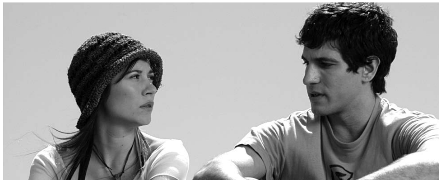
"Azuloscurocasinegro", de Daniel Sánchez Arévalo

Tal i com indiquen els resultats del primer termini de la convocatòria EACEA 04/2007, d'ajut MEDIA a la distribució en la modalitat de Suport Selectiu, 8 empreses de l'Estat espanyol rebran ajut per a la distribució de 12 títols europeus, amb un volum total de 680.000 euros. D'altra banda, Azuloscurocasinegro , de Daniel Sánchez Arévalo, serà distribuïda a Lituània i Suècia amb ajut del Programa MEDIA. ■