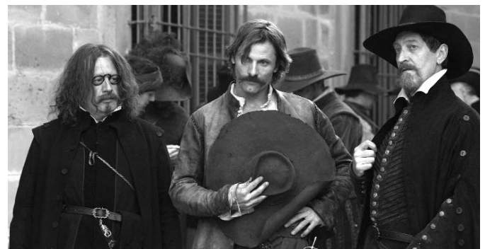
Alatriste, d'Agustín Díaz-Yanes