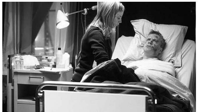
"La vida secreta de las palabras", d'Isabel Coixet