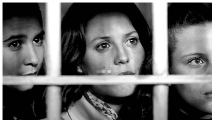
"Salvador", de Manuel Hueriga