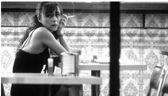
"Princesas", de Fernando León de Aranoa

La votació està oberta fins el 31 d'octubre i es pot fer a través de la pàgina web www.peoplechoiceaward.org o bé a través de la revista Cinemanía . ■