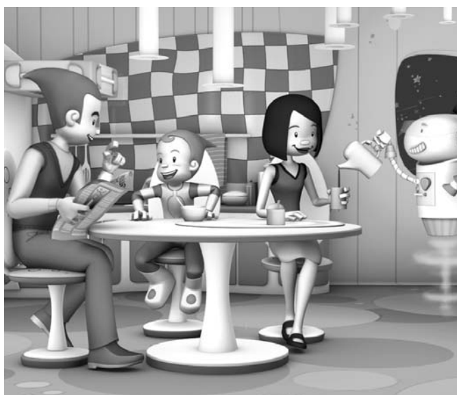
"Cosme el astronauta", de Lion Toons