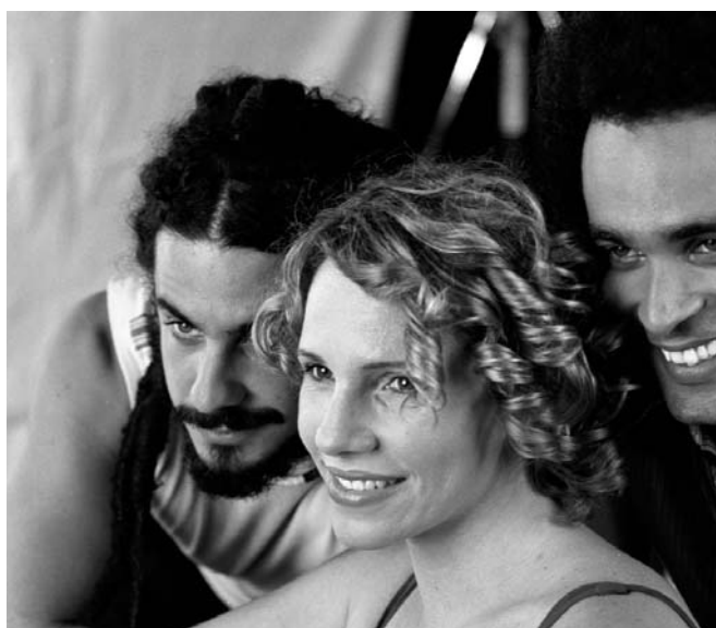
"Habana Blues", de Benito Zambrano