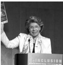
La Comissària Europea Viviane Reding

La Comissió Europea ha posat en marxa una consulta pública sobre la millor manera d'estimular el desenvolupament del mercat de continguts digitals en línia a nivell Europeu, pel que fa a la difusió de pel·lícules, música i jocs. La Comissió està interessada en el foment del desenvolupament de models comercials innovadors i en la difusió transfronterera de serveis de continguts on-line.