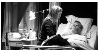
La vida secreta de las palabras