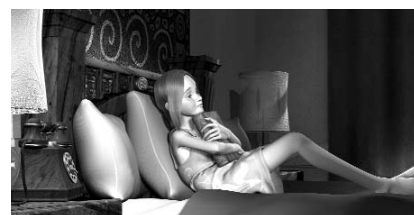
El sueño de una noche de San Juan