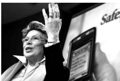
La Comissària europea Viviane Reding

La Comissió Europea està treballant en la implementació d'una estratègia que afavoreixi el desplegament de la televisió mòbil en els 27 països de la UE, buscant el consens sobre una normativa comuna, per tal de reduir la fragmentació del mercat que podria ocasionar la diversitat d'opcions tècniques per a la transmissió de la televisió mòbil. Segons els estudis fets per la Comissió, la tecnologia