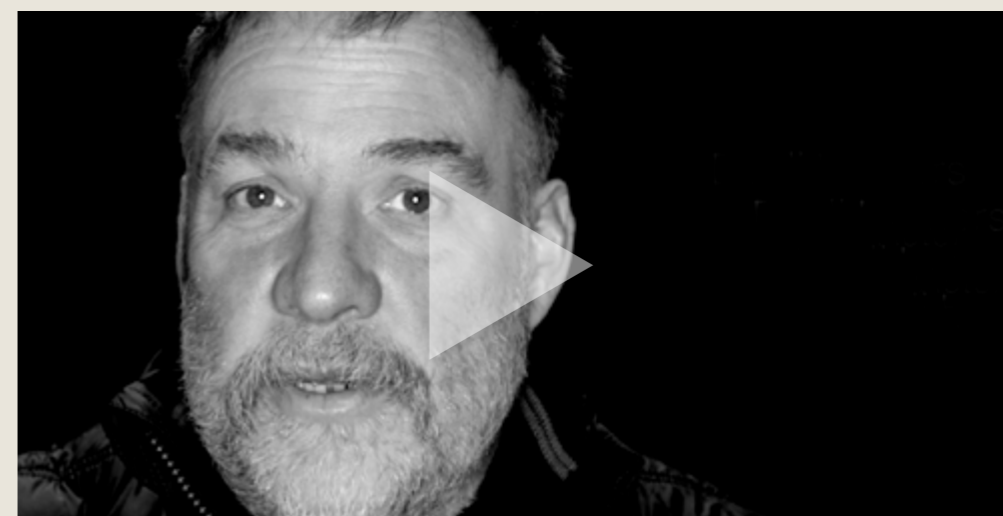
What does European film mean to you?