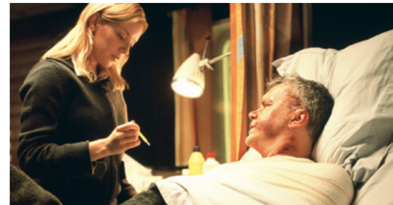
La vida secreta de las palabras