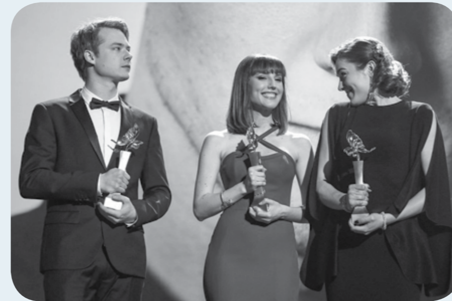
Shooting Stars 2016

Elena Anaya, Goya Toledo, Enrique Alcidés, Eloy Azorín, Fele Martínez, Natalia Verbeke, Eduardo Noriega, Leonor Watling, Juan Diego Boto i Ingrid Rubio.