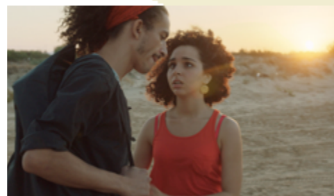
Apenas abro los ojos