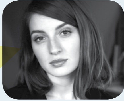
María Valverde