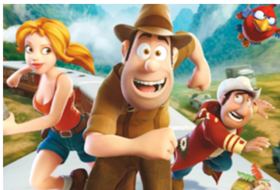
Las aventuras de Tadeo Jones

2012 Insensibles, Juan Carlos Medina – Roxbury Pictures, A Contra- corriente Films, Televisió de Catalunya, Fado Films, Les Films d'Antoine i Tobina Films