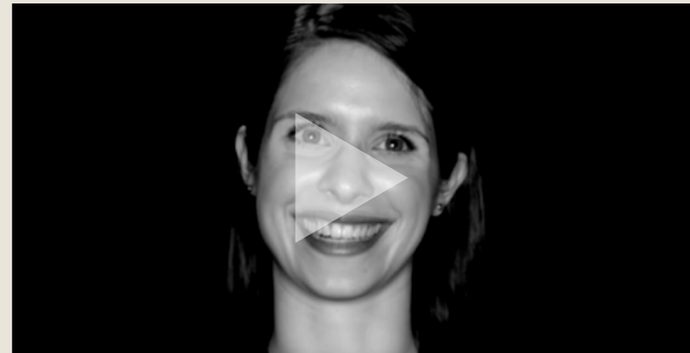
What does the EU MEDIA programme mean to you?