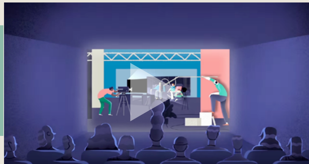
Creative Europe MEDIA - cinema trailer