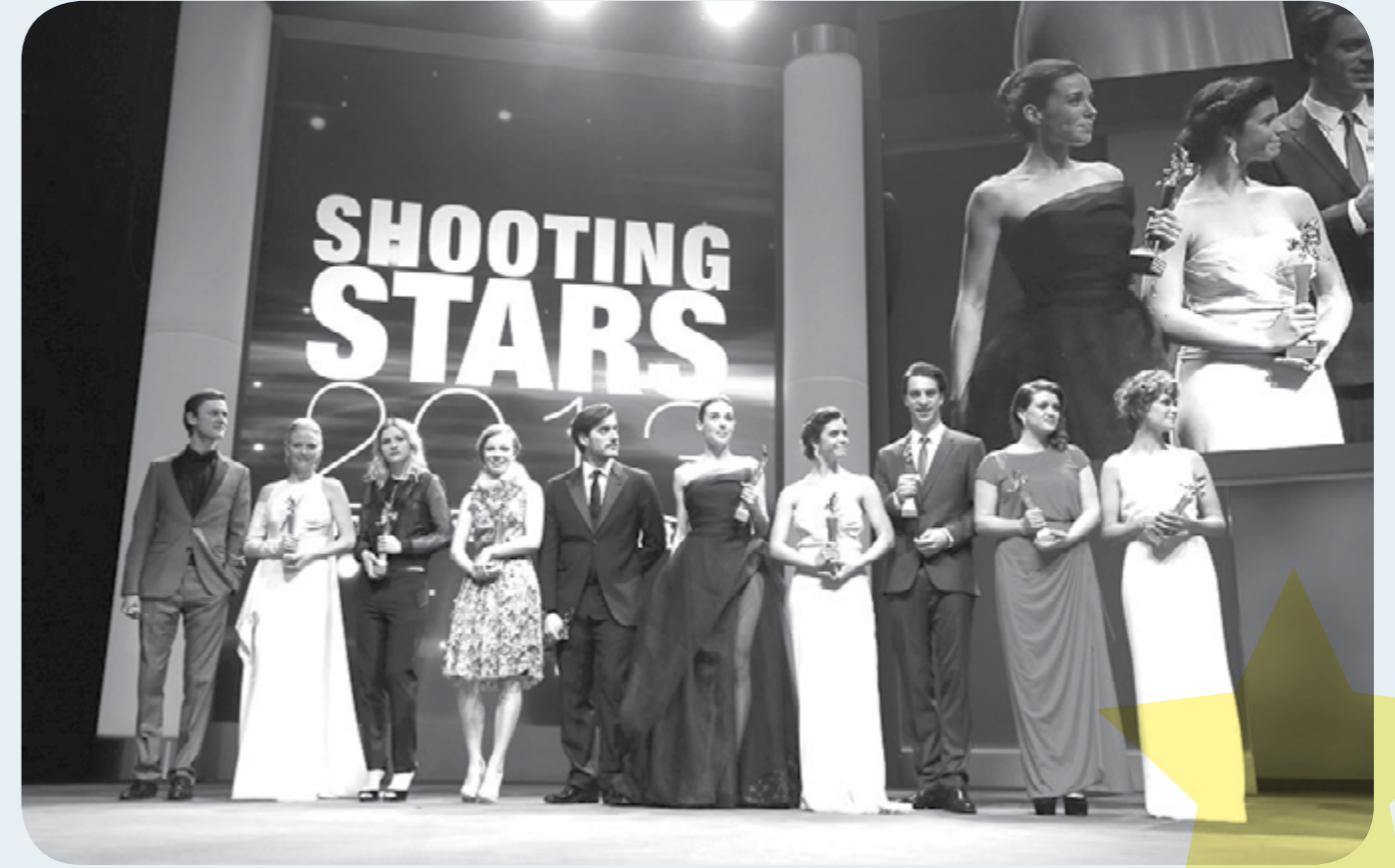
Shooting Stars 2013

Prèviament, gairebé una vintena d'actors i actrius espanyols també van ser presentats al Festival Internacional de Cinema de Berlín com a European Shooting Stars: Clara Lago, Verónica Echegui, Óscar Jaenada, Marta Etura, Unax Ugalde,