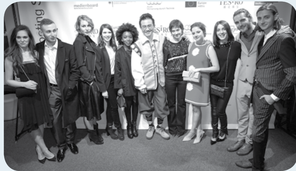
Shooting Stars 2016

L'any anterior, el 2015, Natalia de Molina va ser una de les Shooting Star escollides. L'actriu va guanyar el Goya a la millor actriu revelació pel seu paper a Vivir es fácil con los ojos cerrados (David Trueba).