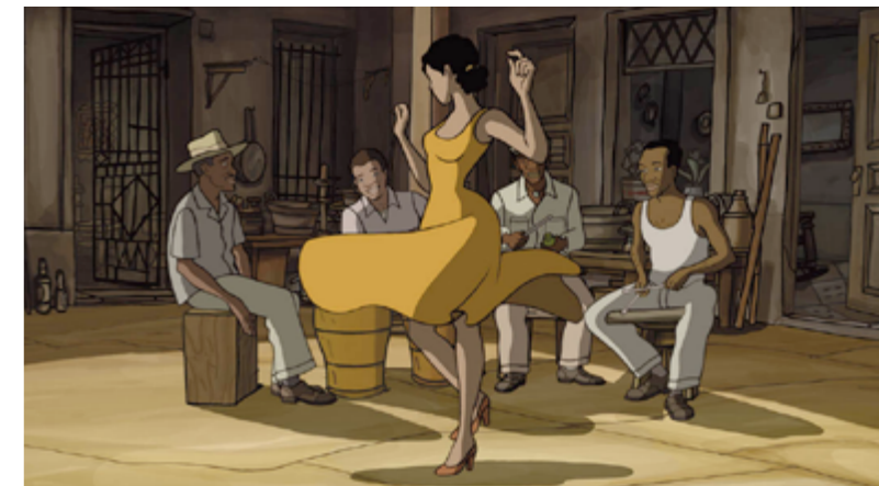
Chico y Rita