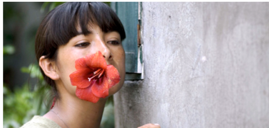
La teta asustada

Transsiberian és una coproducció entre Espanya, Alemanya, Regne Unit i Lituània, que va comptar amb l'ajut de MEDIA a i2i Audiovisual. El film va estar present al Festival de Berlín i al de Sitges, i va guanyar diversos premis, entre els quals dos premis Gaudí.